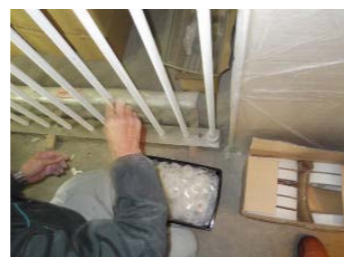
4緩衝パッキン落とし込み