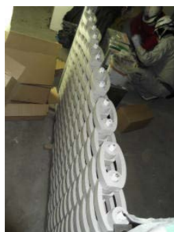
10最上段レベルの確認