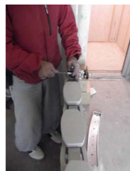
12ボルトの最終締め