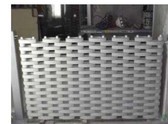
9水平レベルの確認