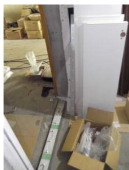
2下部プレートとアンカーボルトを確認