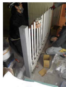
6CSとパッキン落とし込み