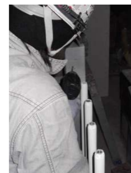
7FBアンカーの穴空け