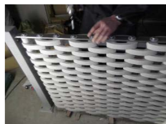
11最上部とFBボルト締め