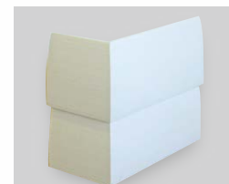
コーナー役物 トメ加工接着