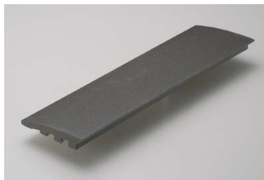
T2-100B IBUSHI 黒釉