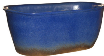
釉：青おふけ 小判風呂 1400タイプ サイズ：1400×900×H580