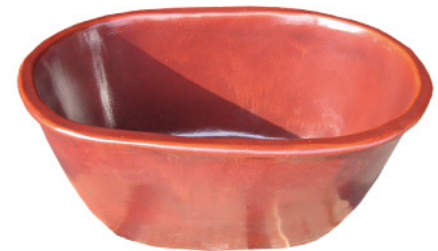
釉：鉄砂 小判風呂 1250タイプ サイズ：1250×870×H580