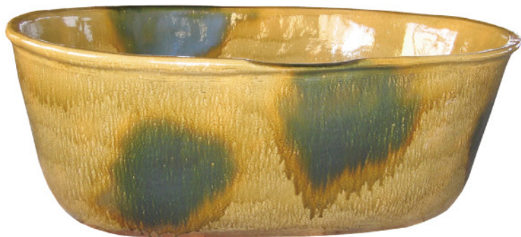
釉：黄瀬戸 小判風呂 1600タイプ サイズ：1600×900×H580

長い間、隣接する瀬戸の窯で焼かれたものと思われ呼ばれてきた名ですが、桃山時代に美濃で焼かれたのが最初です。黄釉を使い、落ち着いた淡黄色のやきものです。室町時代から焼かれた黄色の釉調は古来茶人に珍重されたといわれています。淡い黄褐色の釉に、緑色の胆礬（タンパン緑発色する硫酸銅）と呼ばれる装飾も鮮やかです。